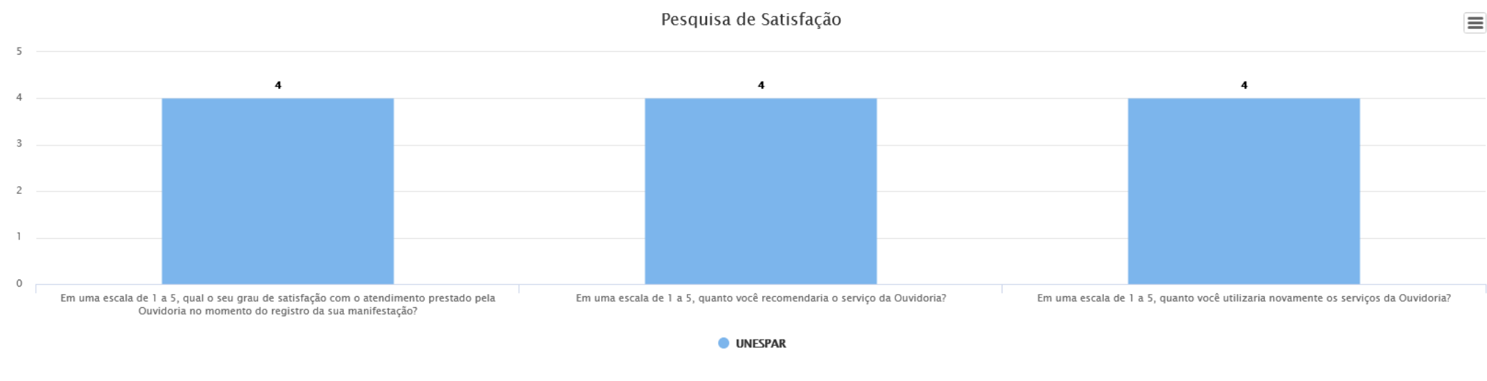
Gráfico baseado no relatório: