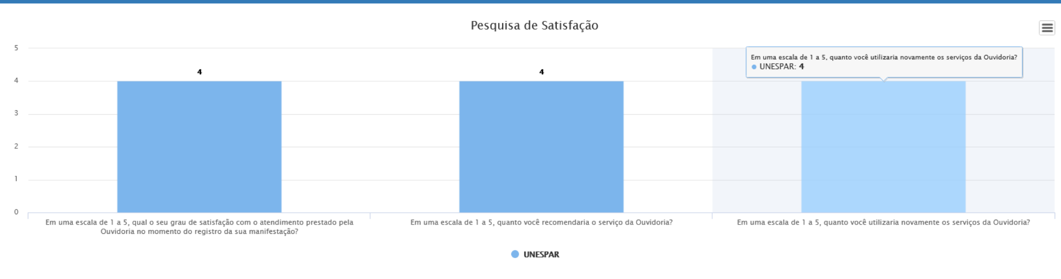
Gráfico baseado no relatório: