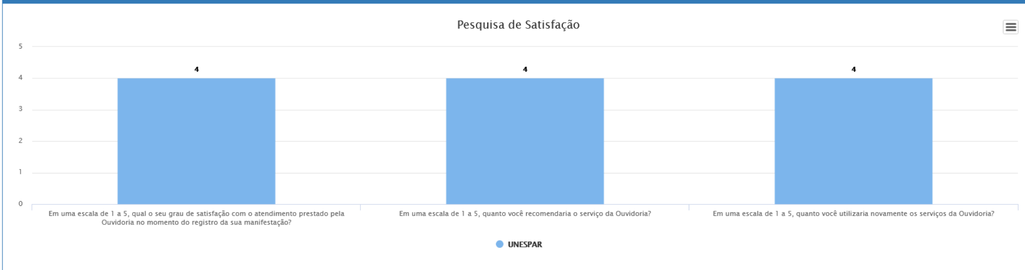
Gráfico baseado no relatório: